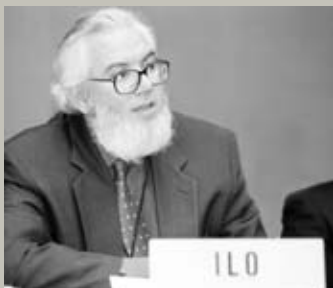
Хуан Сомавия, Генеральный директор МБТ

Международное бюро труда возглавляет Генеральный директор, которого назначает Административный совет. Начиная с 1919 года МБТ руководили: