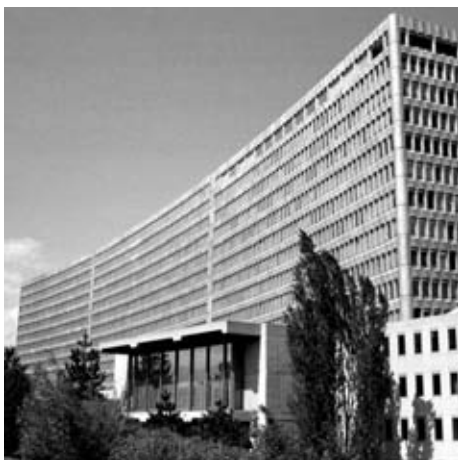
Здание штаб-квартиры МОТ в Женеве

Альбер Тома, Франция (1919–1932 гг.), Гарольд Батлер, Великобритания (1932–1938 гг.), Джон Уайнант, США (1939–1941 гг.), Эдвард Филэн, Ирландия (1941–1948 гг.), Дэвид Морс, США (1948–1970 гг.), Уилфред Дженкс, Великобритания (1970–1973 гг.), Франсис Бланшар, Франция (1973–1989 гг.), Мишель Хансенн, Бельгия (1989–1999 гг.) и с марта 1999 года – Хуан Сомавия, Чили.